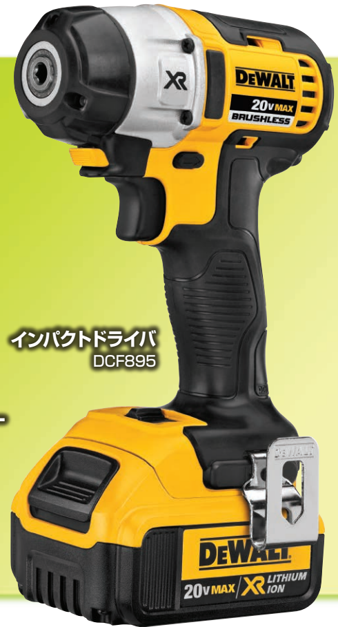
インパクトドライバ DCF895