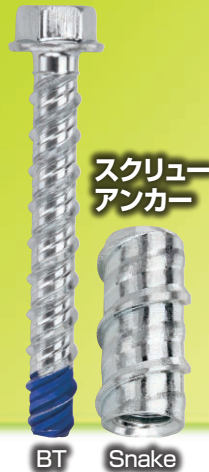
スクリュー アンカー