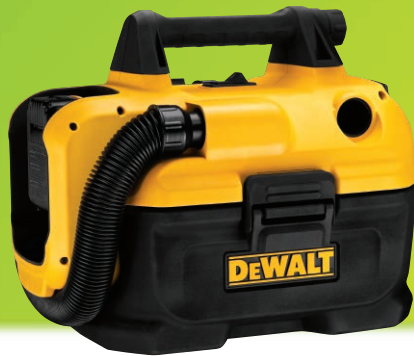
乾湿両用 コードレスクリーナー DCV580