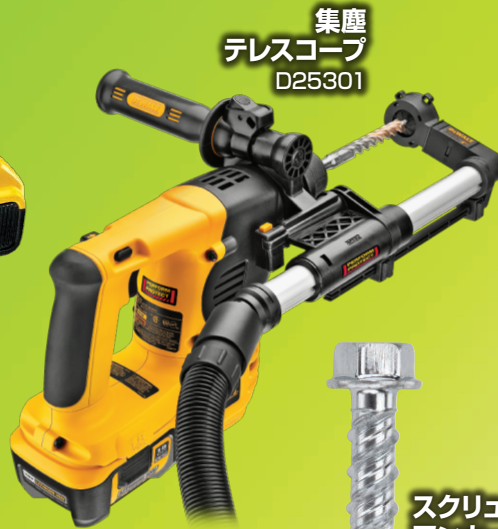
集塵 テレスコープ D25301