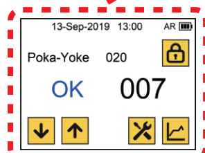
(背面)2.2インチ タッチスクリーン (イメージイラスト)

※お知らせ：初期販売モデルには、「無線通信機能」は付属していません。 後日、無償取り付けをPOPインフォメーションにてご案内します。