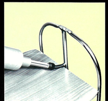
(キッチン・テーブル組立)